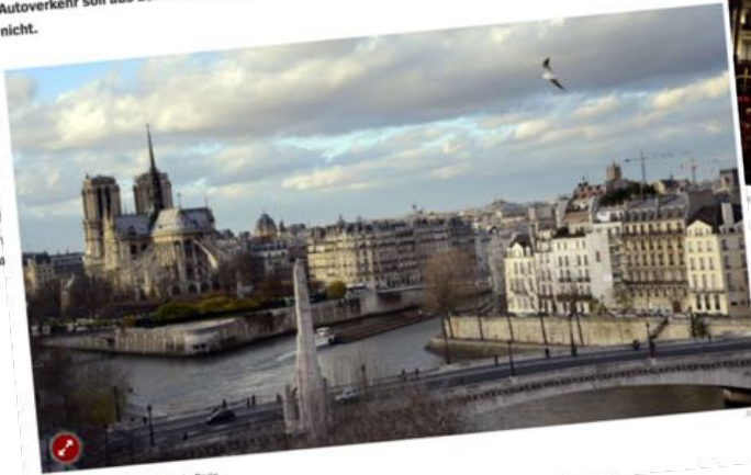
Die Kathedrale Notre Dame in Paris

Die Bürgermeisterin von Paris will das historische Zentrum der Hauptstadt zur Fußgängerzone machen. Der Autoverkehr soll aus der Innenstadt gedrängt werden - nur laufen müssen Anwohner und Touristen aber nicht.